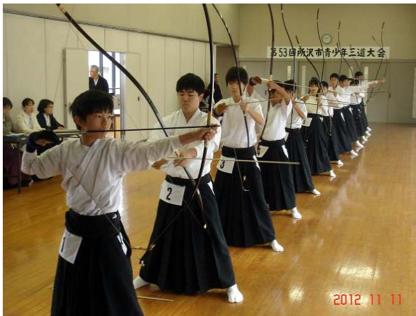
(中学生以下の部の行射)