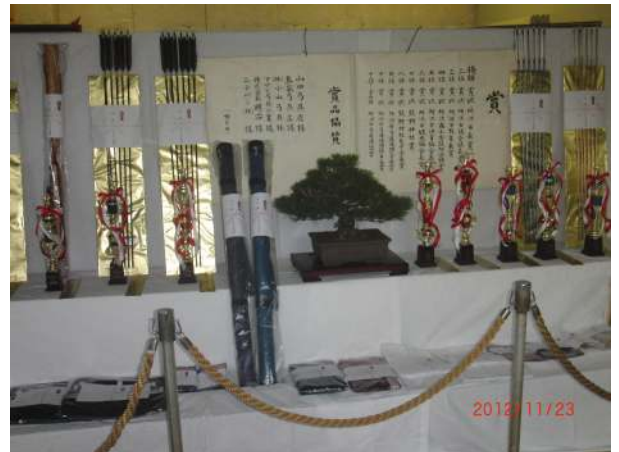
(今回も豪華な賞品)