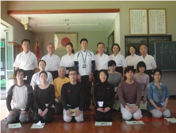
(シンコースポーツ初心者弓道教室の参加者)