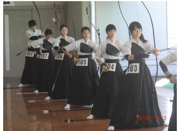
(行射中の三道大会参加選手)

青少年育成所沢市民会議主催の青少年三道大会が行われ、総合開会式は今年も市民体育館で剣道連盟が担当幹事として9時00分から開催されました。