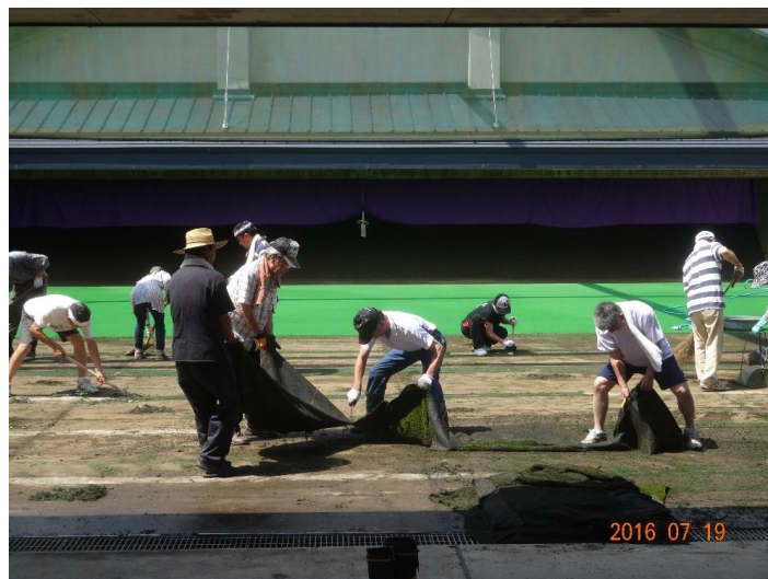
(炎天下での大変な作業でした)

残っていた矢道人工芝半面張替えの支援を行った。参加して頂いた皆様ご苦労様でした。